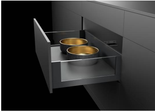
Schubkastensystem AvanTech YOU von Hettich