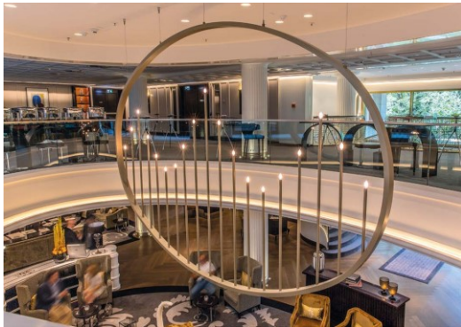
Missal Objekt Licht